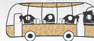
Sala de lectura