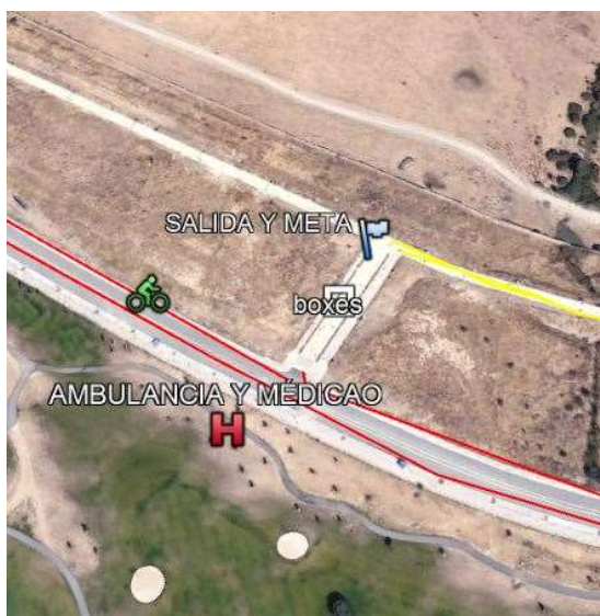
Detalle de la transición.

En rojo recorrido de bici; en amarillo circuito de carrera a pie; competición; P aparcamiento, zona de espera; H ambulancia y médico. Peligro accesos cortados al tráfico.